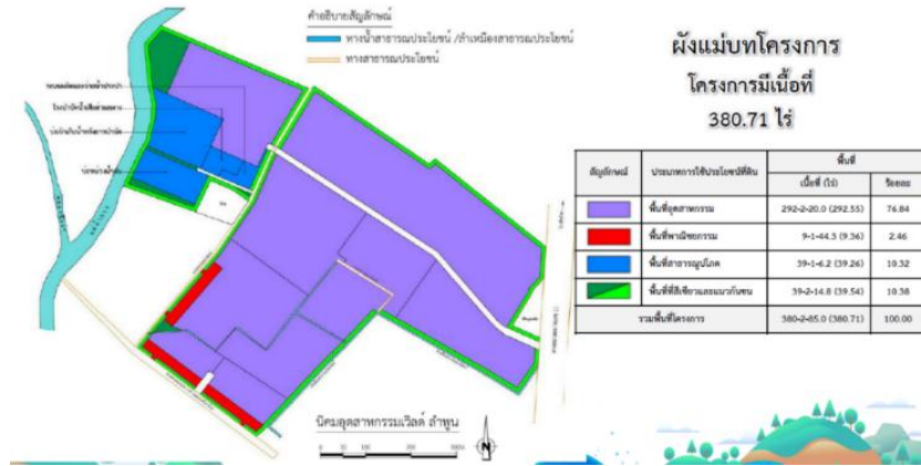
ภาพรายละเอียดพื้นที่โครงการนิคมอุตสาหกรรมเวสต์ (ลำพูน) 1